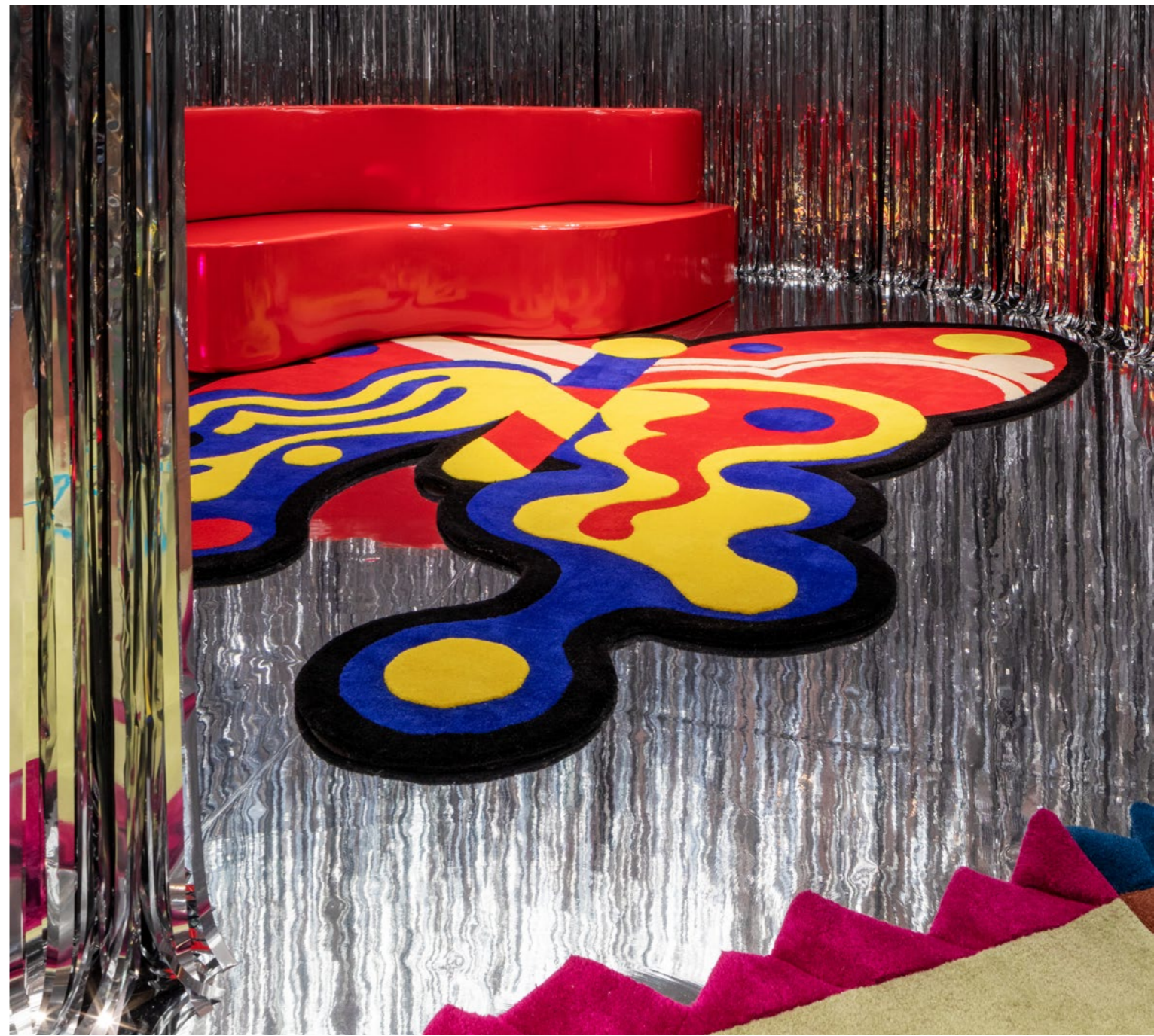
↗ Ultrafavola, Salone del mobile, Milano. 2023