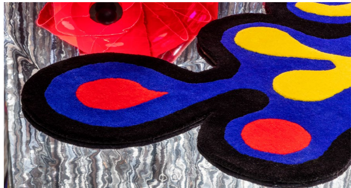
↗ Ultrafavola, Salone del mobile, Milano. 2023