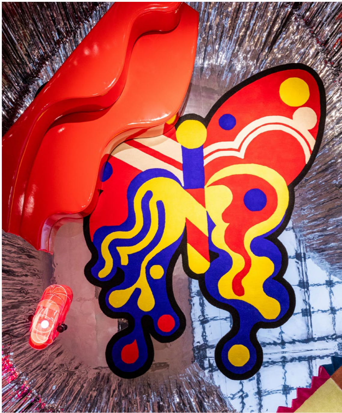
↗ Ultrafavola, Salone del mobile, Milano. 2023